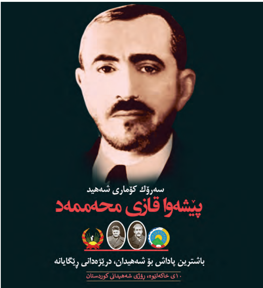
سه‌رۆك كۆماری شه‌هید