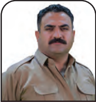
سامیل شه ره فی

ماهییه تی ئه م ریه و سه مه انه له چوارچیوه ی ره قتا ری گشتی خه لکدا به ره له سته کاری و خه باتکارانه یه. جۆریکه له خه باتی جه ما وه ری که خه لکی کوردستان ماهییه تیکی شونا سخوازانه ی پی به خشیوه. ئه م ریه و سه مه انه بوونه ته ده رفه تیکی گشتی که خه لک هاوکات له گه ل شایی و خشیده رپرین، تیایدا ره قتا ری شونا سخوازانه له خۆ نیشان ده دات.