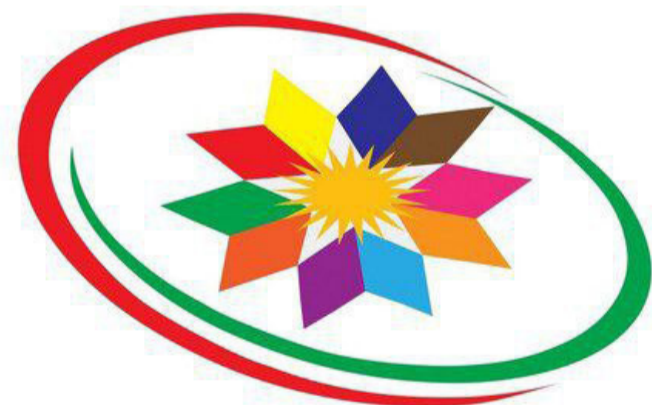
ناوهندی هاوکاری حیزبهکانی کوردستانی ئێران Cooperation Center of Iranian Kurdistan's Political Parties. مرکز همکاری احزاب کوردستان ایران

Navenda Hevkarî ya Partiyên Kurdiştana Îranê