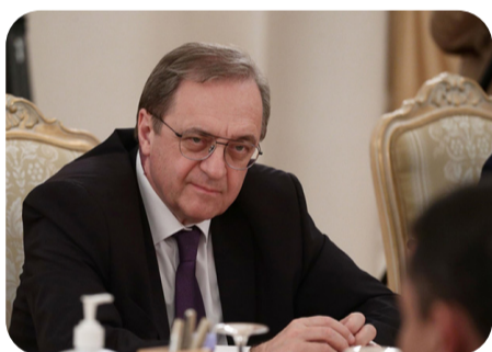
“Mikhail Bogdanov :”

Çareserkirina pirsra Kurdî li Sûriyê ji Amerîka re ne giring e.