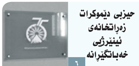
حیزبی دیموکرات زه راته خه ی ئینیرژی خه باتگی رانه