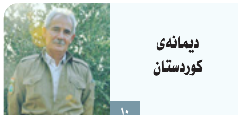
دیمانه ی کوردستان