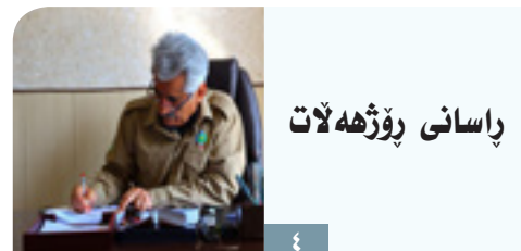
پاسانی رۆژه لات