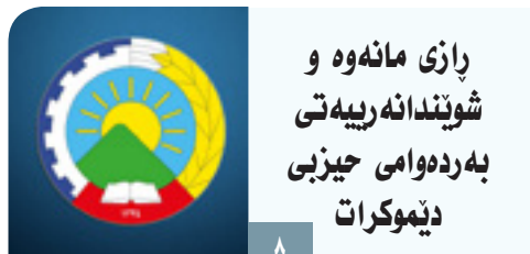
پازی مانه وه و شوندا نه ریه تی به ره وه امی حیزبی دیموکرات