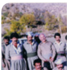
هه لدان و دروستبوون و پیگه یشتن ...