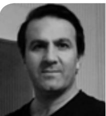
دیمانه ی کوردستان

ژماره ۸۰۵، یهکشه مهه ۳۱ گه لاویژی ۱۴۰۰ هه تایی، ۲۲ ناگوستی ۲۰۲۱