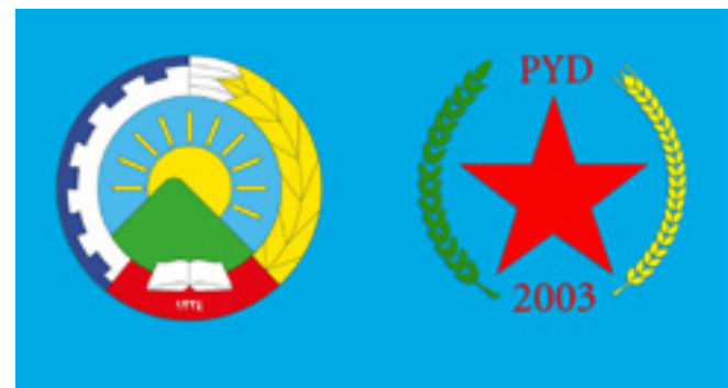
نۆينه رايهتیی پارتی ديموكراتى PYD له هەرىمى كوردستان

رێپۆرتى كار و هەروەها دەستورى كارى دانىشتنەكە بە تىرۆتەسەلى ڕا و بۆچوونى خۆيان خستە بەر باس و بە وردى بايەتەكانى دەستورى كارى دانىشتنەكەيان شۆڤە كرد. هەيئەتەكانى ناوهندى هاوكارى سىياس و پىزانىيى خۆيان له ماوى بەرپررسايەتىيى حيزبى ديموكراتى كوردستانى ئىيران پيشكەش بە هەيئەتى حيزبى كورد و بەرپررسايەتىيى دەرەوى داهااتوو بە هاوڕێيانى «حيزبى ديموكراتى كوردستان» سپێردا.