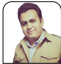
ئەلبورز رۆئىن تەن

و رووداوەكانى يازدەى سېتامبىريان لەبىر لە كۆمەلگە جياوازەكان دەركەوت كە ئەو نىيە و لەگەل پشەكەوتنەكانى دونىاي نەوھە بە پىچەوانەى ئەو چاوەروانىيە ئىنتېرنېت و تەكنۆلۆژيا و شۆرشى گەلىك تايىبەتمەندى سەرنجراكىش و گواستەوھى زانىارى گەرە بوون، بەھۆى گرېنگىان ھەيە كە بۇ كۆمەلئاسان و بە ھەبوونى پەيوەندىيەكى توندوتول كە لەگەل تايىبەتەش بۇ سىياسەتوانان گرېنگىيەكى تەكنۆلۆژى و بەرھەمەكانى و ھەرھادەست زۆرى ھەبوو؛ چونكە ھەلسوكەوت و