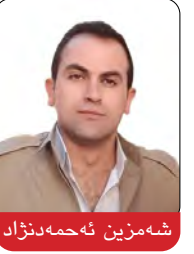
شەمەزىن ئەحمەد نەزاد

وەزىرەى دەرهوەى ئىيران ڤۆژى ۲۲ى رەزەبەرى ئەمسال، له چاوپىكەوتنىكدا دەگەل قاسم ئەعرەجى، سكرتېرى شورای بەرزى ئەمنىيەتى عىراق جارىكى دىكە رايگەياندووە كه "ئاتوانن بىيىنن چىدى هىزە چەكداره تىرۆرىستەكان و جوولەى ئەوان له باشورى كوردستان بەردامە". ئەمىر عبدوللاهيان هاوكات داواى كردووە هەرمى كوردستان و حكومەتى عىراق بەرپرسايەتتى ئەواوى خويان بۆ ڤووبەڤو بوونەوە دەگەل بە گوتهى خۆى [گرووپە تىرۆرىستىيەكان] له هەرمى كوردستانن جىبەجى بكات. بەرپرسانى ئىران له ماوهى ڤۆژانى ئەم راپەرپەندا زۆرتىن جار وشەى تىرۆرىستان بەرامبەر بە حىزبە سىياسەكانى ڤۆژەلاتى كوردستان بەكار هىناوه.