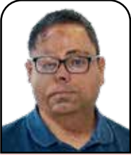
ناگری ئیسماعیل ژااد

به‌ره‌نگ‌ار‌بو‌ونه‌وه‌ی ئەم سیاسه‌ته نامرۆفانه‌یه پ‌و‌ی‌ستی به‌ وشیارایی جه‌ما‌وه‌ری هه‌یه و دبده‌نگ‌یی له‌ به‌رانبه‌ر سیاسه‌تی ت‌یر‌ۆ‌ری ژینگه‌یی و "زه‌ویی سووتاو" ره‌ه‌نده‌کانی ئەم کاره‌ساته‌ ق‌و‌ول‌تر ده‌کات‌ه‌وه. ناب‌ی ئەوه له‌ب‌ی‌ر ب‌ک‌ر‌یت که ئەم شه‌ره ته‌نیا د‌ژی خاک و ئ‌ا‌وی کوردستان نییه، به‌لکوو د‌ژی ناسنامه و پ‌یناسه‌ی کورد و ر‌ۆ‌ژه‌ه‌لاته.