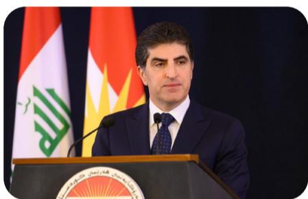
“Nêcîrvan Barzanî :”

Em naxwazin Herêma Kurdiştanê bikin qada şer û pişt cibihey xwe li hember rejîma Îranê