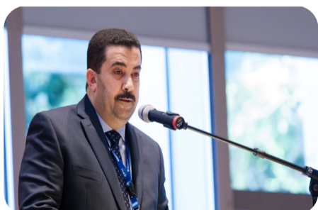
“Mihemed Shia' al-Sudani”

Eger berê tenê hikûmeta Iraqê bû, naha Îranê û heta Tirkîyê jî lê zêde bûne.