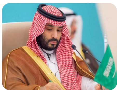
“Mihemed Bin Selman”:

“Girîng nîne ev rêkêvtine navê vê Bercam e yan “baştirîn rêkêvtin”, lê ti alternatîvek ji bo Bercamê nîne”.