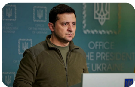
“Volodymyr Zelensky” :

“Ez êrîşa terorîzmê ya li ser Îsrailê şermezar dikim û Îsrailê mafê berevanîkirin li xwe heye”.