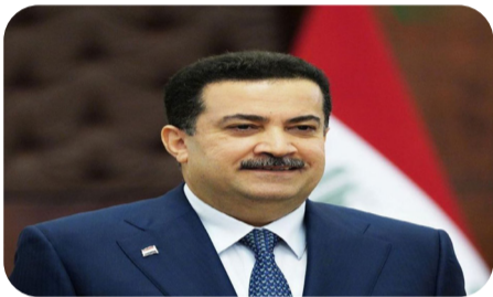
“Mihemed Şyû’î El-Sudanî”:

“John Bolton: Êrişên berdewam yê grûpan dê bibe metirsî li parça Herêma Kurdistanê”