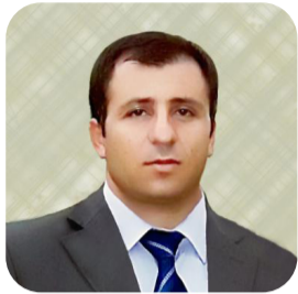
N. Serbest Urmiye

Dengdan wate îradeya welatiyan, bingeha peydabûna şaristaniyeta nû û avakirina hikûmetan e. Ji bo pesendkirina hikûmetê jî, dibe welatî rolê sereke di biriyarên siyasî û îdareya welat de wergirin û divêt ku destûr û yasayên hikûmetê di warên ewlehî û parastina mafên welatiyan de zelal bin.