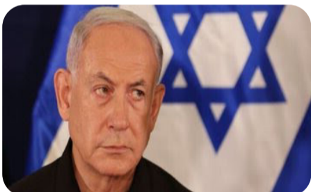
“Benjamin Netanyahu” :

“Wezîrê Derve yê Amerîka Anthony Blinken got ku Îran gefa herî mezin e li ser ewlekariya Îsraîlê û “me hemûyan” û divê ligel alîgirên xwe were îzolekirin.”