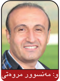
و: مه‌نسور مروه‌تی

هه‌ر وهک له ژماره‌کانی پێشدا باس کرا و له ژماره‌کانی داها تووشدا وهک زنجیره باس به‌رچاوتان ده‌که‌وی، له دیکتاتوریهوه تا دیموکراسی ناوی تووژینه‌وه‌یه‌کی “جین شارپ”، بیرمه‌ندی ناوداری بواری خه‌باتی مه‌ده‌نی و ناتوندوتیژه. شارپ ساڵی ۱۹۲۸ له ئۆهایۆی ئامریکا له‌دایک بووه، دوکتواری فه‌لسه‌فه‌ی سیاسیی بووه و جیا له مامۆستایه‌تی له زانکۆکانی ئامریکا، بۆ لیکۆلینه‌وه له سه‌ر خه‌باتی ناتوندوتیژ سه‌ردانی زۆر ولاتی کردوه و ته‌نانه‌ت زۆر جاریش بۆ په‌روه‌ده‌کردنی خه‌لک سه‌ری له ولاتانی دیکتاتورلیدراو هه‌لینه‌او و له‌وه‌ گرینگتر له چه‌ند ولاتیک خۆی گه‌یاندووته‌ ریزی پێشه‌وه‌ی ناپازییان و تیکه‌ل به خه‌لکی ئازادبخواری ئه‌و ولاتانه‌ بووه. کاکلی ئیده‌کانی جین شارپ ئه‌وه‌یه‌ که “دیکتاتۆره‌کان هه‌یزی سه‌ره‌مکی خۆیان له گوێزایه‌لی و ملکه‌چی خه‌لکه‌وه و ده‌ست دینن، ئه‌گه‌ر خه‌لک ئاوا ملکه‌چ و گوێزایه‌لی ده‌سه‌لاتداران نه‌بن ده‌توانن دیکتاتۆره‌کان به‌ چۆکدا بێژن یا ده‌نا مه‌جبوور به‌ ئالوگۆریان بکه‌ن.” له‌م زنجیره‌ باسه‌دا باس له‌ بنه‌ما فیکریه‌یه‌کانی “جین شارپ” بۆ خه‌بات دژی دیکتاتۆری ده‌کری: