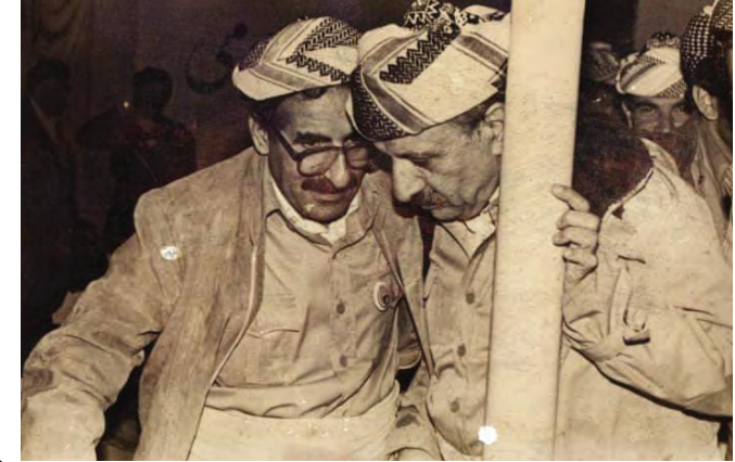
کۆمیته‌ی ناوه‌ندی حیزبى ديموکراتى کوردستان ۱۳۹۹/۱۱/۱۶ (۲۰۲۰/۱۱/۱۶)

نهمری بۆ یاد و ناوی خۆی و به‌ره‌راری بۆ ئامانجه‌ پیرۆزه‌کانی.