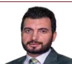
مانیفیستی نوێی بزوتنه‌وه‌ی خۆیندکاری له‌ ئێران