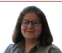
حیزبی دیموکراتی کوردستان و پرسی ژن له‌ کۆمه‌لگه‌دا