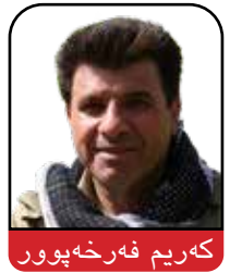
که ریم فەرخبور

(به بۆنه ی تو مار کردنی سه ربرده ی ۱۰۰ پيشمه رگه ی نيشتمانه وه)