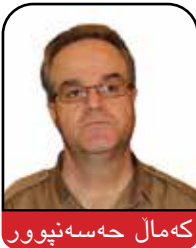
کهمال حه سه نیوور

باوه و په نگی پیوه ندی راسته خۆی به شیوه ی ده سه لاتداریی کار به ده ستانه وه هه بی، واته گه ندله ی، به رتیلخۆری و فیل کردن، کرین و فرۆشتنی به ناو "پایان نامه" یه که به شیوه ی به ربلاو له ئێران ده بیند ر. (۷) باسی ئەوهش ناکه ین که زۆر به ی ده سه لاتداریی په به رزی ولات، به روانه مانه کانیان یان ساخته یه، یان به شیوه ی گومانای وه ریانگرتوون. ئەو دوو دیار ده یه لانی کم له سه رده می پاشایه تیدا شتیکی نه ناسرا و بوون. تۆ بلنی که لینی زانستی ولات ده گه له دنیا ی پیشکه وتوو به ساخته کاری و گه ندله ی پر بکریته وه؟