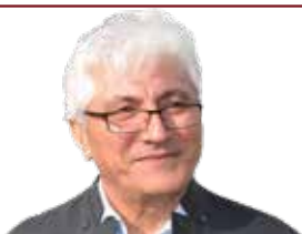
هیما نه‌ته‌وه‌یه‌کان په‌مز و نیشانی نیشتمان