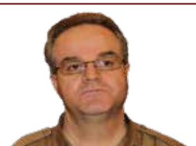
ورینه‌کانی خامه‌یی کۆتایان نایه