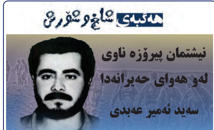
نیشتمان پیروژه ناوی

بووژاندنەوی بەر جام، هەناسە میسیح بو ئابووری ولات یان درێژ کردنەوی تەمەنی رێژیم؟