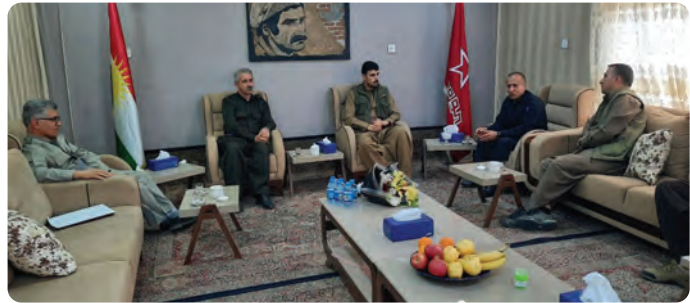
خۆی له چاله ره شه کانی کوماری ئیسلامی ئیراندا به سه ر برد، لوحی ریزلینان له لایه ن ئه نجومه نی زیندانیه سیاسییه کانی رۆزه لاتی کوردستان پیشکش به ناوبراو کرا، هه ر له و دیداره دا کتیپی دیروکی خۆراگری که ژیا ن و به سه ره تاتی ده یان به ندرکراوی سیاسی تیدا نووسراوه ته وه پیشکش به به ریزیان کرا.

دوا ی ئه وه ی به ندرکراوی سیاسی کورد چه نگیز قه ده م خه پری دوا ی ۱۱ سال به ندرکان له چاله ره شه کانی کوماری ئیسلامی ئیران بزگاری بوو، رۆژی ۲۴ ره شه مه هه یه تی که له ئه نجومه نی زیندانیه سیاسییه کانی رۆزه لاتی کوردستان به مه به ستی به خیره تانه وه ی سه رداننی ناوبروایان کرد. له و دیداره دا دۆخی به ندرکراوی سیاسی کورد و پیشلکاریه کانی مافی مرۆف له لایه ن کوماری ئیسلامی و هه ره وه ا باسی دۆخی ناله باری زیندانه کانی کوماری ئیسلامی تاوتوی کرا و هه موو لایه ک هیوای ئه وه یان خواست که به ندرکراوی سیاسی، په گرتوانه و له ژیر چه تری ریکخوا ییکا کار له سه ر که یسی به ندرکراوی سیاسی بکه ن.