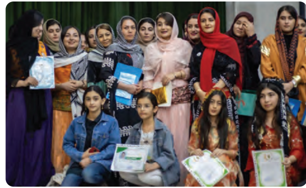
پیوستی فیربوونی زمانی کوردی، پاراستنی شوناسی نه ته وه یی و گرینگیدان به کولتور و فه ره نگ و دابونه ریتی کورده واری داگیراوه.

هه ره وه ا رۆژی دووشه ممه ۱۶ ره شه ممه ی ناوه نده فه ره نگیه کانی «بانه» له هۆلی «ناربایا» کۆریکیان بق ریزگرتن له و که سانه ی له خوله کانی فیرکاریی زمانی کوردیدا به شدارییان کردوه، پیکه هینا.