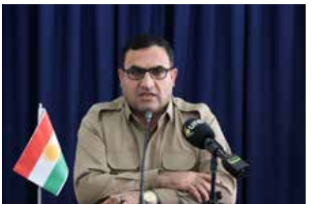
دەفتە‌ری کۆیه، پشدر و بتوین

رۆژی سێشە‌ممە، ٢١ی پووشپەر کۆمیتە‌ی گشتیی تە‌شکیلاتی ئاشکرای حیزبی دیموکراتی کوردستان بە‌ بۆ‌نه‌ی سی‌وسپه‌مین سالوگە‌ری تیرۆری شه‌هید دکتور قاسملوو، سکر‌تیری گشتیی حیزب و ه‌ا‌وریانی، بە‌ بە‌شداریی دەیان که‌س له‌ ئە‌ندامانی حیزب، دانیشتوو له‌ ناوچه‌کانی کۆیه، بتوین و پشدر، کۆبوونە‌وه‌یه‌کی بە‌ریوه‌برد.