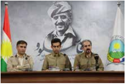
بنکە‌ی دەفتەری سیاسی حیزب

(بەشیک لە کۆریاد، سەمینار و کۆبوونەوه‌کانی حیزب لە سی‌وسپه‌مین سالیادی تیرۆری شه‌هید د. عەبدولرەحمان قاسملوو)