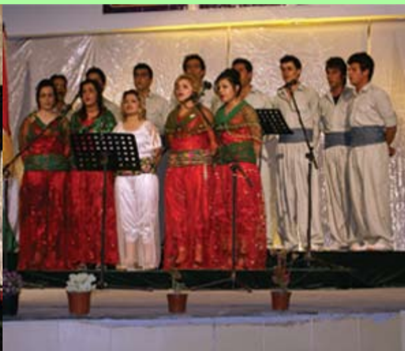
کۆرسی کۆری هونه‌ریی حیزبی دیموکراتی کوردستانی ئێران