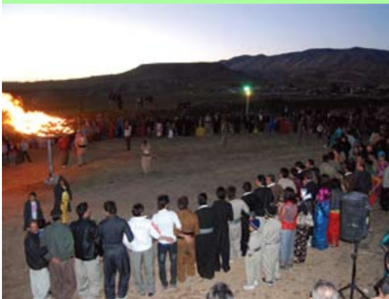
دیمه‌نی هه‌له‌په‌رکیی نه‌ورۆزی ۱۳۹۱ له‌ بنکه‌ی ده‌فته‌ری سیاسی