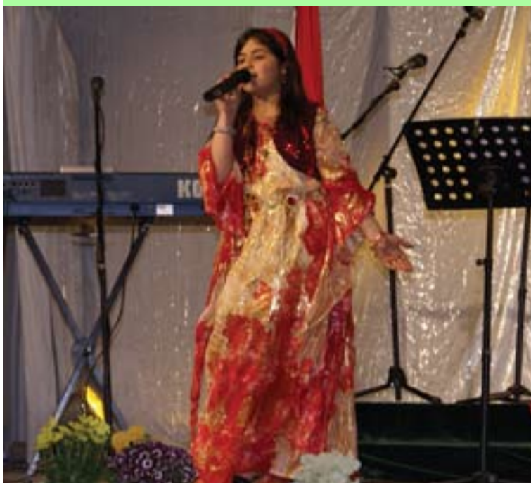
کێژۆله‌ی هونه‌رمه‌ند: هه‌یقێ پشتیوان