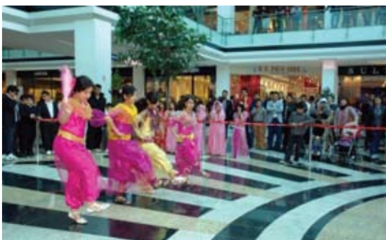
۱۱ مارسه‌وه‌ ده‌ستی پێکردوه‌ و تا ۲۰‌ی مارس درێژه‌ ده‌کێشی و به‌شی دووه‌می له‌ ۲۱ تا ۲۵‌ی مارس به‌رپۆه‌ ده‌چی.

ئێواره‌ی رۆژی پێنجه‌مه‌، رێکه‌وتی ۱۳۹۰/۱۲/۲۵‌ی هه‌تاوی مندالانی کوردستانی ئێران سه‌ر به‌ ناوه‌ندی نێرگه‌ر بۆ په‌روه‌دی فیکری و هونه‌ریی مندالان و میزمندالانی کوردستانی ئێران بۆ پێشوازیکردن له‌ نه‌ورۆز، نمایشی هه‌له‌په‌رکییان له‌ چوارچێوه‌ی «شه‌مه‌مین فستیقای» پایته‌خت، فستیقای نازادی و نه‌ورۆز» له‌ نێو گۆرپانی فامیلی مۆلی شاری هه‌ولێر به‌ یارمه‌تی گروپی دۆق شارته‌ر به‌رپۆه‌ برد. له‌م نمایشی هه‌له‌په‌رکییه‌دا که‌ له‌ «رۆژی تابه‌ت بۆ چالاکیی مندالان»ی فستیقاله‌که‌ به‌رپۆه‌ چوو، چه‌ندین هه‌له‌په‌رکیی ناوچه‌ جیاوازه‌کانی کوردستانی ئێران پێشکه‌ش به‌ ناماده‌بووان کرا و نه‌م چالاکییه‌ی ناوه‌ندی نێرگه‌ر له‌ لایه‌ن خه‌لکی شاری هه‌ولێر و گه‌شتیاره‌ بیانییه‌کانه‌وه‌ به‌ گه‌رمی پێشوازی لێکرا. هه‌ر له‌و رۆژدا، نه‌م گروپه‌ له‌ پارکی شانه‌ده‌ر و پارکی سناره‌ به‌ره‌مه‌ هونه‌ریه‌کانی خۆیان پێشکه‌ش به‌ ناماده‌بووانی فستیقای نه‌ورۆزی شاری هه‌ولێر کرد. شه‌مه‌مین فستیقای پایته‌خت، فستیقای نازادی و نه‌ورۆز، به‌ بۆنه‌ی ۳۲‌ه‌مین سالیادی ئیمزاکردنی رێکه‌وتنه‌نامه‌ی میژوویی ۱۱‌ی ئاداری سا‌لی ۱۹۷۰ له‌ نیوان سه‌رکرده‌یه‌تی کورد و حکومه‌تی نه‌وسای ئێراق و ۲۱‌ه‌مین سالیادی پاپه‌رینی هه‌ولێر، پایته‌ختی کوردستان، به‌رپۆه‌ ده‌چی. به‌رپۆه‌رانی فستیقاله‌که‌ رایانگه‌یاندوه‌وه‌ که‌ یه‌کێک له‌ نامانجه‌کانی فستیقای نه‌مسال، نه‌وه‌یه‌ که‌ بیه‌ته‌ هه‌نگاوێکی گه‌رنگ بۆ هه‌ولێر بۆ وه‌رگرتنی نازناری پایته‌ختی گه‌شتیاره‌ی سا‌لی ۲۰۱۴. شایانی باسه‌ به‌شی یه‌که‌می فستیقاله‌که‌ له‌