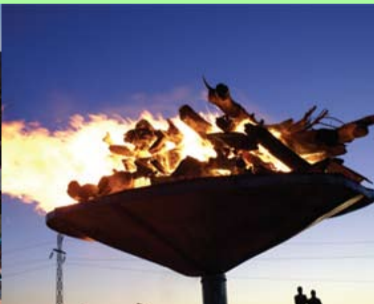
مه‌شه‌لی نه‌ورۆزی ۱۳۹۱