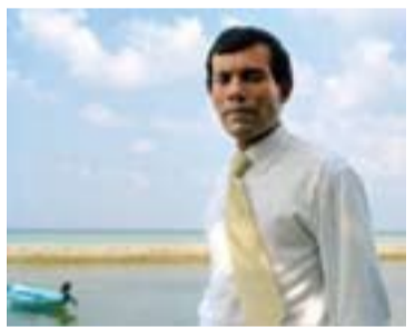
دیهمه‌تێك له فیلمی سه‌ركۆماری دووره‌