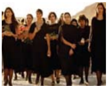
دیهمه‌تێك له فیلمی ئیستا بۆ كو‌ی به‌رپۆه‌ن؟