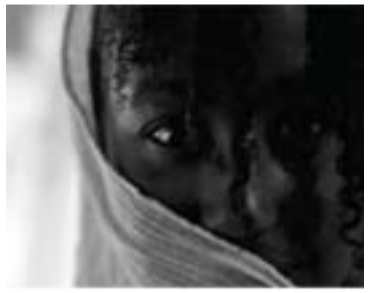
دیهمه‌تێك له فیلمی به‌هه‌شتی به‌چوك