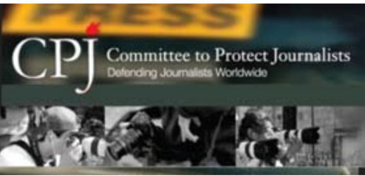
كۆماری نیسلامی وه‌كو پێشله‌كه‌ری نازادی كۆماری نیسلامی له رۆژنامه‌نووسان.

چاپه‌مه‌نی شه‌رمه‌زار كرده‌وه. به‌پێی راپۆرتی رادیو فه‌ردا، شه‌م كومه‌ته‌ كه ناوه‌نده‌كه‌ی له نامریكا‌دا‌یه، به‌ نا‌ما‌زه به ده‌سته‌به‌سه‌ركردنی ته‌هه‌ینه موزه‌وی و نازه‌نین خوسه‌روانی، كۆماری نیسلامی به‌ گوشاره‌یتان بۆ چاپه‌مه‌نی تۆمه‌تبار كرده‌وه. ته‌هه‌ینه موزه‌وی، وێنه‌گرێكه كه له‌سه‌ر باهه‌تگه‌لی‌ی كۆمه‌لایه‌تی وه‌ك تووشبون به مادده سه‌ره‌كه‌كان و كار‌تۆن خه‌وه‌كان كاری ده‌كرد و له رێبه‌ندانی سا‌لی 90دا ده‌سته‌به‌سه‌ر كرا. نازه‌نین خوسه‌روانی، رۆژنامه‌نووسه‌یه‌کی سیاسیه‌ كه پێش له سا‌لی نۆتی هه‌تا‌وی،