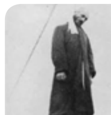
کوردایه‌تى به‌رپرسياره‌تییه‌کى عه‌قلانى و نه‌خلاقى