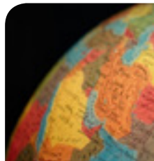
ژینۆپۆلیتیکی ئیران، لاوازییهکان، هه ره شهکان و مهترسییهکان