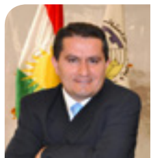
دیمانه ی کوردستان

ژماره ۸۱۰، شه ممه ۱۵ خه زه ئوه ری ۱۴۰۰ هه تاوی، ۶ ئۆقامبری ۲۰۲۱