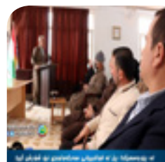
وته کانی ئیبرسراوی گشتی حیزب له رپۆره سمی ریزگرتن له قوتابییانی نیو شو ریش