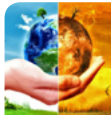
گه رمبوونی زه وی کیشه ی هاو به شی مرو قایه تی