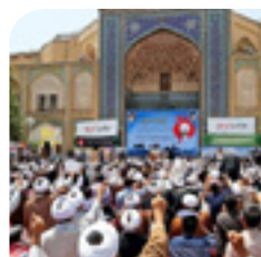
بودجه مان له جه وزه ی عیلمیه کمه و له هه ژاریدا ده ژین! نکایه زیادی بکه ن