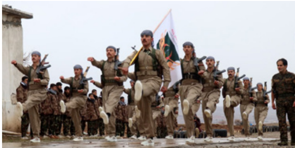
پيئمه‌رگه‌ى كوردستان ناماده‌ كرابوو له‌لایه‌ن به‌شداربووى ده‌ره «جه‌مئه‌ل» كۆتايى پيئهات.