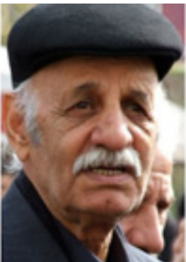
جيزبى ديموكراتى كوردستانى ئيران لېپرسراوى گشتى مسته‌فا هيجرى ۱۶ رېبه‌ندانى ۱۴۰۰ى هه‌تاوى كوردستان ناوه‌دان.

نیشتمانى خۆشه‌ويستمان، شاعىرىكى ده‌روه‌ست له‌باوه‌ش ده‌گرت و هه‌موومان بۆ مه‌رگى داخدارين، به‌لام شيعره‌كانى و خزمه‌ته‌كانى به‌ زمان و كه‌لتورى نته‌وه‌كه‌ى تا هه‌تا په‌ زينه‌وه‌ و مندالانى نه‌وه‌كانى كوردى پى بار ده‌هينرت. به‌بۆنه‌ى مه‌رگى شاعىرى پايه‌به‌رز «په‌رته‌و كرماشانى» سه‌ره‌خۆشى له‌ هه‌موو نته‌وه‌ى كورد و په‌تايه‌ت خه‌لكى نيشتمانپه‌روه‌رى كرماشان و له‌ كۆمه‌لگه‌ى ئەده‌بى و رووناكبيرى كوردستان و هه‌روه‌ها بنه‌مائه‌لى داخدارى ده‌كه‌م. رۆحى په‌رته‌وى شاعىر شاد و نيشتمانى كوردستان ناوه‌دان.