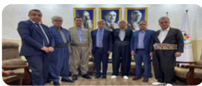
وێرای تا‌وتوتیکردنی بارودۆخی کوردانی تارا‌وگه، گرینگیی کار و چالاکیی کونفیدراسیۆنی ره‌وه‌ندی کوردستانی و رێکخه‌سته‌وه‌ی کوردانی تارا‌وگه‌ له‌په‌نئا‌و