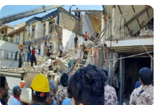
حیزبی دیموکراتی کوردستانی ئیران ده‌زگای رێکخه‌ستی گشتی

له‌ده‌ست دا‌وه‌ و ژماریه‌کی تریش بریندار بوون و زیانیکی زۆر به‌ر ساختمانه‌که‌ که‌وتوه.