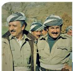
په‌یامی م.حه‌سه‌ن شیوه‌سه‌ ئی به‌بوته‌ی سا ئوه‌گه‌ری شه‌هیدانی قییه‌ن