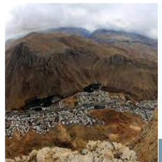
چاوبرسییه‌تی داگیرکه‌ر بو خاکی کوردستان (ماکو)