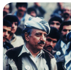
هزری دوکتور قاسملوو، فه‌له‌سه‌فه‌یه بو ژیا‌نیکی نازاد و سه‌ربه‌ست