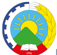
که شتی ی حیزب له ئیوگه رده لولوی روودا وه کانی ...