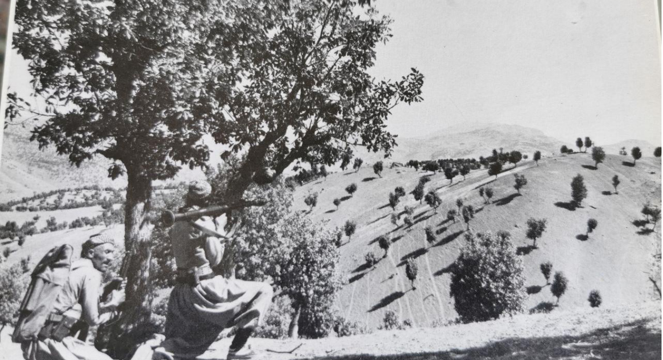
ئێوان حیزب و پارتی و پارتی و پارتی