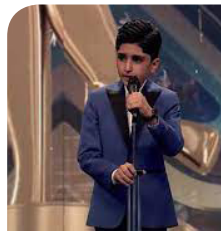
دوو تابلۆ و دوو دیمه نی دژواز