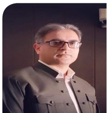
دیمانه ی کوردستان

ژماره ۸۲۸، شه ممه ۱۵ گه لاویژی ۱۴۰۱ هه تاوی، ۶ ئاگۆستی ۲۰۲۲