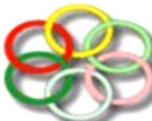
Congress of Nationalities for a Federal Democracy • Freedom • Pluralism

جارینکی دیکه‌ پیرۆزه مه‌که‌ته‌ی سیاسی حیزبی شیوعی کوردستان