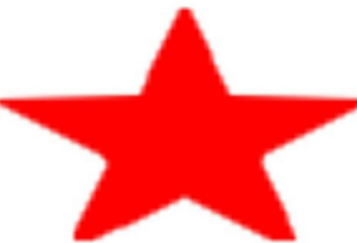
په‌یامی حیزبی رزگاری کوردستان به‌بۆنه‌ی ۲۵ گه‌لاویژ

کۆنگره‌ی نه‌ته‌وه‌کانی ئێرانی فیدراڵ سه‌ره‌وای ریزگرتن له‌ هه‌یه‌ته‌کانی وتووێژ بۆ ئاکام گه‌یاندنی پرۆسه‌ی په‌که‌خته‌نه‌وه‌، له‌ ئیراده‌ی هه‌ردوو لایه‌نی دیموکرات هه‌یواداریی ده‌ربریه‌وه‌ که‌ شه‌ر حیزبه‌ له‌ داها‌تووی نزیکی خۆیدا، خه‌بات دژی رێژیمی ئێران به‌گورتر بکات. له‌و راگه‌یه‌نده‌راوه‌دا ها‌توووه‌ که‌ ئیله‌م وه‌کوو هاو‌په‌یمانیه‌کی سیاسی که‌ حیزبی دیموکرات تیدا نه‌ندامه‌، شه‌م په‌که‌خته‌نه‌وه‌ به‌ نیشانه‌ی ئیراده‌ی به‌هه‌زی نه‌و حیزبه‌ بۆ به‌رگری له‌ بایه‌خه‌ میژوویه‌کان و پته‌وکردنی خۆمان له‌ خه‌بات دژی رێژیمی ئێران بۆ وه‌دیه‌ینانی ئامانه‌کانی بزوتنه‌وه‌ی میلی - دیموکراتیک له‌ کوردستان و هه‌روه‌ها بزوتنه‌وه‌ی نازادیه‌خوازان له‌ سه‌رتاسه‌ری ئێران ده‌زانین. کۆنگره‌ی نه‌ته‌وه‌کانی ئێرانی فیدراڵ په‌که‌خته‌نه‌وه‌ی دیموکراته‌کانی به‌ هه‌نگاوینکی گرینگ له‌ راستای به‌هه‌زیبوونی ریزه‌کانی شه‌و هاو‌په‌یمانیه‌ سیاسییه‌ زانیوه‌ چونکه‌ حیزبی دیموکرات له‌ دامه‌زراندنی کۆنگره‌ی نه‌ته‌وه‌کانی ئێرانی فیدراڵ رۆلینکی گرینگ هه‌بووه‌.