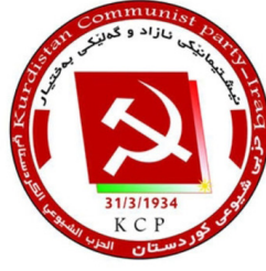
په‌یامی حیزبی شیوعی کوردستان به‌بۆنه‌ی ۲۵ گه‌لاویژ

به‌رێزان نه‌ندامانی ده‌فته‌ری سیاسی حیزبی دیموکراتی کوردستانی ئێران سلاوینکی برابانه‌ی گه‌رم ... به‌رێزان؛ به‌ناوی خۆمان و نه‌ندامانی مه‌که‌ته‌ی سیاسی و کۆمیته‌ی سه‌رکردایه‌تی