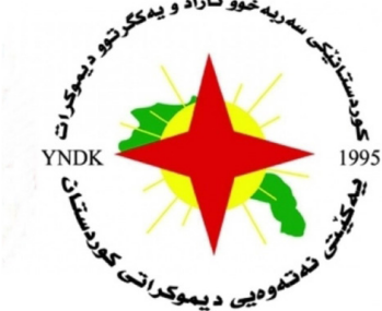
په‌یامی پیرۆزبایی په‌که‌یه‌تی نه‌ته‌وه‌یی دیموکراتی کوردستان به‌بۆنه‌ی ۲۵ گه‌لاویژ

۱۶ی ناگۆستی ۲۰۲۲ی زایینی ۲۵ی گه‌لاویژی ۱۴۰۱ی هه‌تاری