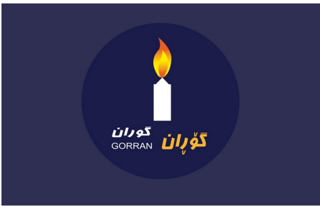
په‌یامی «بزوتنه‌وه‌ی گۆران» به‌ بۆنه‌ی ۲۵ گه‌لاویژ ۲۷مه‌ین سانه‌گه‌ری دامه‌زرانی حیزبی دیموکرات

له‌ کۆتاییدا؛ دووباره‌ هه‌یوای سه‌رکه‌وتنتان بۆ ده‌خوازین و سلاو له‌ خه‌بات و به‌رخودانی رۆژه‌لاتی کوردستان ده‌که‌ین و به‌جاری ریزه‌وه‌ لێی ده‌روانین و هه‌یوای پینشقه‌چوون و سه‌رکه‌وتن بۆ خه‌باتی رۆژه‌لاتی ولات ده‌خوازین و جه‌خت ده‌که‌ینه‌وه‌ سه‌ر پته‌وکردن و پینشقه‌بردنی په‌یوه‌ندی برابانه‌ی نیوانمان له‌ پیناو زیاتر خه‌مه‌تکردن و پینشقه‌بردنی دۆزی ره‌وای گه‌لی کوردستان و گه‌یشتنمان به‌ مافه‌ ره‌واکانمان ... له‌ گه‌ل سلاو و ریزی دووباره‌ماندا . هه‌ر بۆین و سه‌رکه‌وتوو بن بۆ کورد و کوردستان براتان غه‌ فوور مه‌خمووری سکرته‌یری گشتیی په‌که‌یه‌تی نه‌ته‌وه‌یی دیموکراتی کوردستان YNDK ۱۵ی ناگۆستی ۲۰۲۲