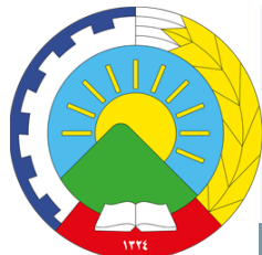
که‌شتیی حیزب له‌ نێوگه‌رده‌لوونی رووداوه‌کانی ...