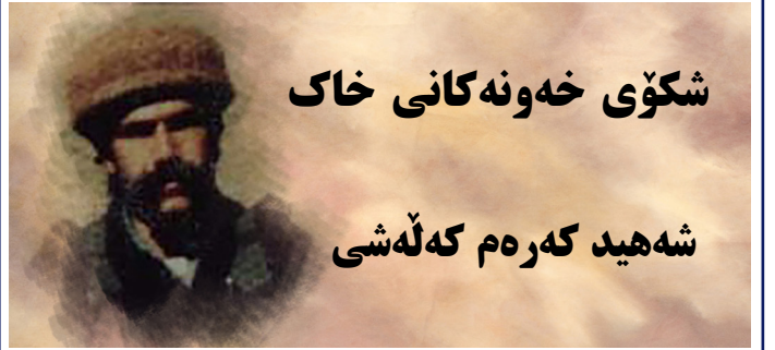
شکوی خه‌ونه‌کانی خاک