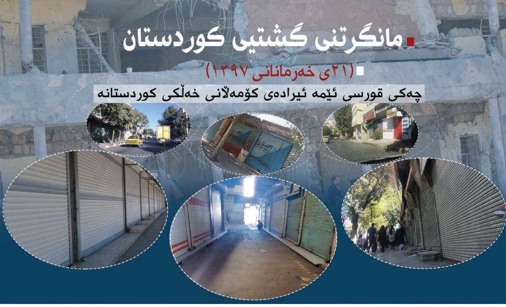
مانگرتنی گشتیی کوردستان (21 خه‌رمانانی 1397) چه‌کی قورسی ئیله‌ ئێرا‌ده‌ی کومه‌لانی خەلکی کوردستانه‌

هه‌رچه‌ند زۆرن ئەو ساته‌ میژوویییه‌ له‌بیره‌که‌راوانه‌ی له‌ سه‌ده‌ی رابردوودا گه‌لی کورد له‌ پێناو چه‌سپاندنی شوناسی نه‌ته‌وه‌یییدا توماری کردوون، به‌لام له‌و نووسینه‌ کورت‌دا ته‌نیا ناما‌زیه‌کی کورت به‌ گرینگترین رووداوه‌کانی دوا شوێشی ٥٧ و به‌تایبه‌ت مانگرتنی به‌رین و سه‌راسه‌ریی خەلکی کوردستان له‌ 21 خه‌رمانانی سالی ٩٧ ده‌که‌ین.