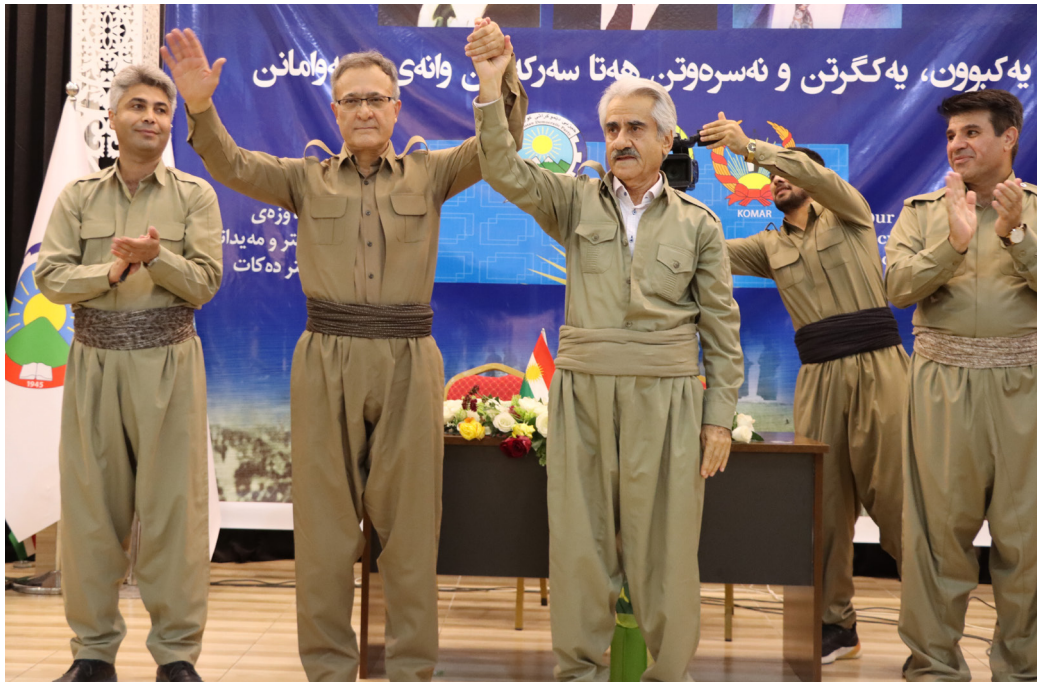
بۆ دیاریکردنى مافی دیاریکردنى چارههنوس له پێشهكوتوترین شکیلدا خهبات بگهن.

بهرنامهى حیزبى دیموكرات و ئەو دوروهدمیهنهى كه بۆ بونیاتنانهوهى ئەم نیشتمان لهم حیزبهدا پێناسهى بۆ كراوه، پێویستى به ههموو هیز و پۆتانسییل و توانای خهلكى كوردستان ههیه، لهم نیوهشدا ژنان ئەركى قورسیان له سهر شانه، چونكه به پێچهوانهى ههموو چین و توێژهكانى دیکهى كۆمهلهگهى كوردستان هاوكات چهندين ئەركى دیکهیان لهسهر شانه كه دهیبى هاوتهریب خهبات بۆ جیههچیکردنیان بگن؛ بۆیه پێویسته ژنان و بهتاییهت ئهوانهى كه له ریزهكانى شۆرشدان، زیاتر ههست به بهرپرسیایهتى و پێشهنگایهتى بگهن و يهكگرتنه وهى ریزهكانى حیزب بگهنه دهرفتهتیکى نوئ بۆ ههستانهوهیهكى دووباره بۆ گهیشتن به ئامانجه گهورهكه.