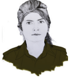
۱ ناسۆ ساعدى