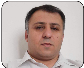
N: Serbest Urmiye

Di êrîş bi navê "Bahoza El-Eqsa" de ku baskê şerajo yê Hamasê b navê Ezedîn Qesam 14 rojan berî niha li dijî Îsrayîlê destpêkir û tê de hejmareke zêde xelkê sivil hatin kuştin û heta qasekê taqîma destpêker a şer kete nava axa Îsrayîlê, bû sedma bersivdaneke cidî û xurt ji aliyê dewleta Îsrayîlê ve. Bi terzekê ku hemû dem û dezgehên wî welatî hatin ser hêlê û îlana rewşa awarte ya şer hate kirin.