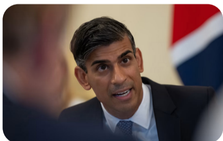
“Rishi Sunak” :

“Armanca Îsraîlê jinavbirina yekcarî ya Hemasê ye û em ê bi yekcarî wan ji nav bibin”.