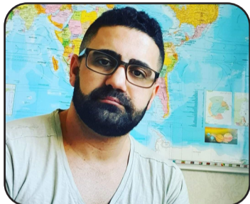
N. Hûmen Simko

Şerê li navbera Hamas û Îsraîlê, niha yek ji girîngtirîn û aloztirîn pirs-girêkên devera Rojhilata navîn e û nigeriyên cîhanî li pey xwe aniye. Ew şer li devera Xezê de dest pêkiriye û bûye sedem ku welatên din seha nigeraniyeke kûr bikin û li pey destêw-erdan li deverê de bin. Li wî şerî de rejîma Îranê wek piştevanê Hamasê, piştevanîkiriuna xwe ji vê girûpê daye zanîn lê înkara her cure rola li vê êrîşê de dike.