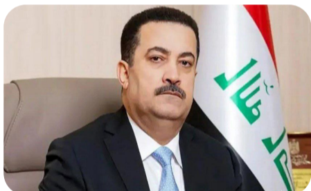
“Muhammed Şiya El-Sûdanî” :

“Hoşyar Zêbarî: Eniya Berxwedana Iraqê herêmê ber bi şerekî berfireh ve dibe”