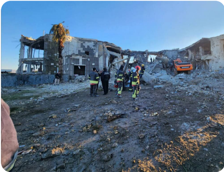
Hizba Demokrat a Kurdistanê Navenda Birêveberiya Giştî 26ê Befranbara 1402 a Rojî 16ê January 2024

NAVENDA BIRÊVEBERIYA HIZBA DEMOKRAT: "EM ÊRÎŞA BO SER SERWERIYA AXA ÎRAQ Î HERÊMA KURDISTANÊ ŞERMEZAR DIKIN"