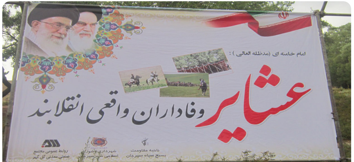
Diruşma rêjîmê bi armanca zindîkirina êl û eşîran û valakirin îrada neteweya Kurd " Eşîr emegdarên rastîne rêjîmê "

Heta neteweyên Fars, Turk û Ereb li Rojhilata Navîn jî ku gellek pîlanên mezin birêve birine bona rakişandina Kurdan bo nav kultûra eşîr û êlan û paşde hêlane, xwe weke netewe pênase û rêxistin kirine. Ji ber ku ew dizanin ku neteweyek ku xwe bi pêkhatiyên biçûk parve bike, ji taybetmendiyên netewî vala dibe û kultûra êl, eşîr û hoz û pêkhatiyên biçûktir biqedirtir dibin. Bi wî awayî yekîtî, tebahî û hevgirtin li ser pirsên çar-nivîsê yê girîng bo gel di-jwar dibin.