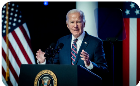
“Joe Biden” :