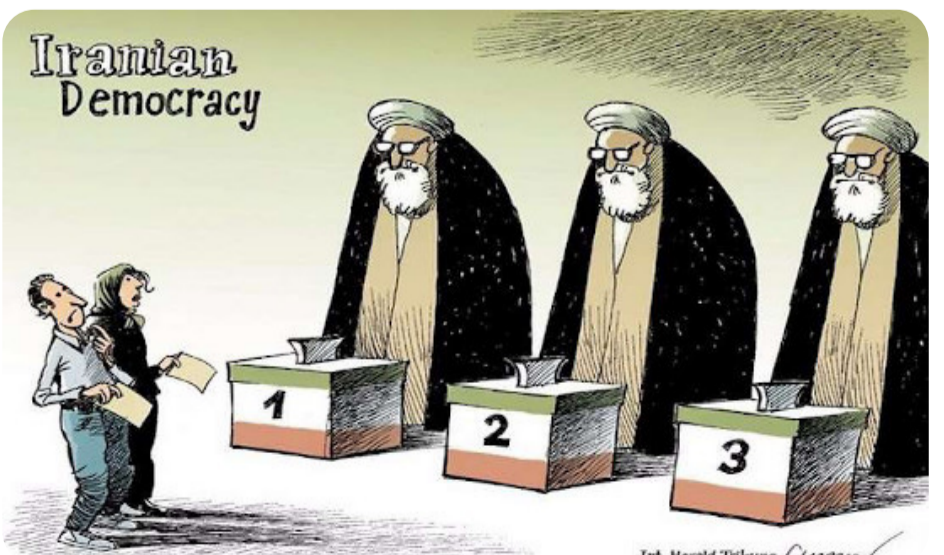
Int. Herald Tribune Clumparts

Ji ber vê yekê redkirina mafê Hesên Rûhanî ku bi xwe bi salan postên bilind li welêt hebûne û desthilatdar bûye, Ev nayê wateya hatina kesekî ji wî baştir, belku hîleyek nû ye ku kirîzên kombûyî yên Îranê li ser bêhêziya serokekî bi nav bike û soza reforman bide xelkê, Lê niha gelê Îranê dizane ku ji berbijêrên ku parzûna Encûmena Çavdêriyê derbas dikin xirabtir tiştêk nine, tev xerab in û hêviya guhertinê di nava vê rejîmê de nîne.