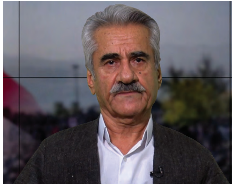
هاونیشتمانیاڤانی هیژا! کوردستانیاڤانی خۆراگر!

تاکوو واتای کوردستانجیوون و به‌ها نیشتمانی و مروّیبه‌کانی روونتر بکاته‌وه. به‌رگری نه‌توهی و خهباتی جه‌ماوه‌ری له کوردستان، بوو به قوتابخانه‌یه‌ک بۆ هه‌موو ئه‌وانه‌ی چاویان له گۆرانکاریه. داگیرکەر و ده‌ستوپه‌وه‌ندییه‌کانیاڤان هه‌موو هه‌ولیاڤان ئه‌وه بووه، ئیمه وه‌کوو کۆمه‌ل له‌ناو بیه‌ن و بمانگه‌ن به‌تاک. به‌لام له‌وه‌یه‌ک ساله‌دا، کۆمه‌لگه‌ی کوردستان جاریکی دیکه ئه‌و ئیراده‌یه‌ی له‌خۆی نیشان دایه‌وه و سه‌لماندییه‌وه که کۆیه‌که له‌پیناوه‌یه‌که ئامانجیکی مروّی و نه‌توه‌یه‌یدا خه‌بات ده‌کات و، هیز و وزه‌ی شو‌رشگیرانه‌ی خۆی ده‌خاته‌وه‌ گه‌ر.