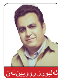
ئهلپورز پروین تهن