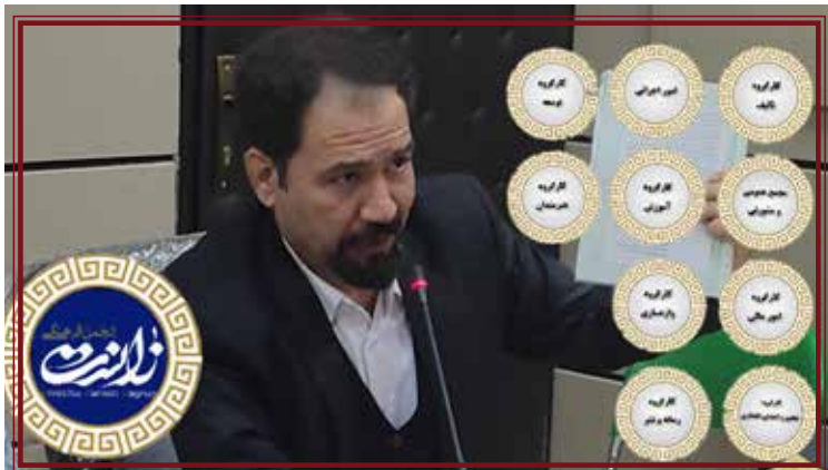
ئەركەكان و بەواداچوون بۆ کاروباری ئیداری و نامەکان، کارنامەکان و دابەشکردنی بەرھەمە کۆلتوربیهکان و...

ئەنستیتۆی «زانست» له ئیلام دەسبەکاربوونی خۆی راگەیاندا.