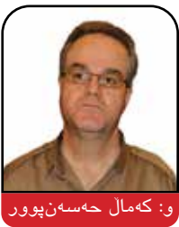
و: که مال حسن پور

ټیران رهنگی چاوه پروانی ټو جوړه هاندانه پته وه بن که به رپوه به رایه تی ټوباما له ۲۰۰۹ خوی لی بوارد. شتی که هه لېژاردنه که ټاشکرای کرد ټوهیه که رپیه ری گه وره چیدیکه پشتگیری له بووکه له ی "رېفورمخواز" وهک سهر کوټماری پیشوو هه سهر رووحانی و وه زیره ی دهره وه چه واد زهریف له نیو رېژیمه که یدا ناکا. رابردووی ره ټیسی ټوه دهره خا که ټو که سیکي گرینگه و دهوری که سیی بؤ درېزه پیدانی کوټرولی بنه ماله کی خامنه یی به سهر ټیرانه وه ده کړی.