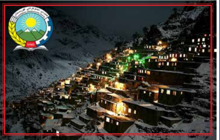
(په‌يامی ده‌فته‌ری سیاسی به‌یۆنه‌ی تۆمارکرانی دیمه‌نی کولتووری هه‌ورامان له لیستی میراته جیهانییه‌کانی یونیسکو‌دا)

رێخراوی فێرکاری، زانستی و فەرهنگیی رێخراوی نەتەوه یه‌گرتووه‌کان (یونیسکو) به بێباریک ناوچه‌ی هه‌ورامان له رۆژەهلاتی کوردستانێ خسته ریزی میراتی کولتووری جیهانی ئەم رێخراوه‌یه.