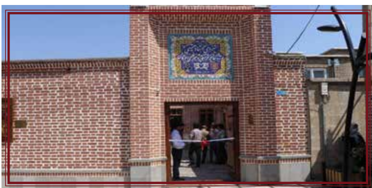
مامۆستا حەقیقی سالی ۱۲۸۴ی هەتاوی لەدایک بوو و لە کۆماری کوردستاندا حەقیقی بە نازناوی (ع. هونە ر) بابەت و بەرھەمەکانی بلاو کردووئەو. حەقیقی جگە لە دیوانە شیعریهکی بەشیک لە شیعەرەکانی حافیزی شیرازی و هەرۆهە گولستان و بوستان سەعدی و کیمیای سعادت کردووئە کوردی. ئەو لە ۲۶ی بەفرانباری ۱۳۷۵ی هەتاوی کۆچی دوايي کرد.

رۆژی سێشەممە ریکەوتی ۱۲ گەلاویژی مالی مامۆستا «عەباس حەقیقی» شاعیری ناوداری سەردەمی کۆماری کوردستان و سەرنووسەری گۆقاری «هەلالە» لە شاری «بۆکان» کرا بە مۆزەیی فەرھەنگی و شۆینی ئاسەواری ناودارانی کورد.