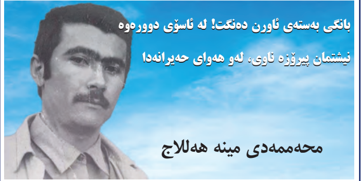
بانگی بهستی ناورن دهکت! له ناسوی دوروهه