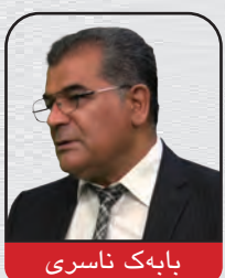
بابه ک ناسری

به تیروانینیکی بیلا یه نانه بۆ رووداوه کان به ئاسانی بۆمان ده رده که وئ که جیلی نو ئی پییه ندی هیچ کام له دروشمه کانی ئه م ریژمه نه بووه و نییه. نویتیرین نیشانه که شی ئه م کۆبوونه وه بیده نگ و هه رایه ی شیراز بوو که ده نکدانه وه که ی له رزی خستوته دلی ریژمه وه. ژماره یه کی زۆر له کیژ و کورپی لاو و تازه پیگه یشتووی شیرازی به رواله تیکه گونجاو -هه له به ت له گو شه نیگای ده سه لاته وه نه شیوا- له پارکیدا کۆبوونه وه و کاتژمیریکیان به پیاسه و قاچه خلیسکی برده سه ر. هه ر ئه وه به س بوو تا بانگه وازی ماستا وچییه کانی ریژمی ئیسلامی بگاته ته شی ئاسمان و به ناله و فه غانه وه بلین که ئیسلام و هه موو به ها کانی له نیوب ران و ژیر پین خران!