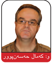
و: کهمال خه‌سه‌ن‌بوور

هاوکات که هیواکان بۆ ژيانده‌وه‌ی ریککه‌وتنی ناوکی 2015 کال ده‌به‌وه و بایدن خه‌ریکی خۆ ئاماده‌کردن بۆ یه‌که‌م سه‌فه‌ری خۆی وه‌ک سه‌رکۆمار بۆ ئیسرائیل و عه‌ره‌به‌ستانی سه‌عوودی له مانگی داهاتوویه، سه‌رکۆمار جۆ بایدن له‌ژێر زهختی په‌ره‌هه‌ستین له‌لایه‌ن هاوپه‌یمانانی ئەمریکا له خۆر‌هه‌لاتی نیوه‌راست‌دایه تا پلانیکی گونجاو بۆ سنووردارکردنی ئێران دارپێژیت.