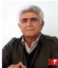
پیام آقای مسن شرفی، ...