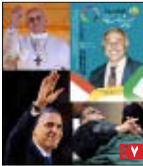
پانورامای رویدادهای سال ...

تأمین حقوق ملی خلق کرد در چهارچوب ایرانی دمکراتیک و فدرال