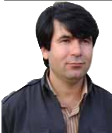
A: îdrîs Sitwet

Şaristana Sîrwan yek ji şaristanên parêzgeha Îlamê ye û nawenda wê şaristanê jî bajarê Lomar e û ev şaristane li sala 1391'an (2012)ji şaristana Şîrwan Çrdawil cuda bû, ev şaristane ji bakur tevî şaristana Serabilê, ji başûr tevî şaristana Derêşehr, ji rojhelat tevî parêzgeha Loristan û ji rojava tevî şaristana Îlamê hevsînor e. Akinciyên vê şaristanê kurd in û bi kurdî û bi devoka Kelhorî dipeyvin û li hin deveran jî wek deverên Hîlan jî bi devoka Lekî dipeyvin.