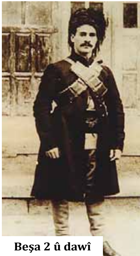
Beşa 2 û dawî

Piştî serketina şworeşa Oktobra 1917'an ku Linîn li hember berjewendiyên sîtratejî yê Soviyetê bo parastina piştê ewlehiya herêma li bin desthilata xwe, peyam bo Îran û Turkiyê şand ku ew wê axa wan çol bikin û yekîniya çekdarên Asoriyan hilveşînin, û dirêjî bi siyaseta Rosiya Tezarî li dijî wan welatan nadin. Îdî koşka hêviyên Asoriyan diherife û bi vî halî jî em dibînin Asorî bi bê ber-