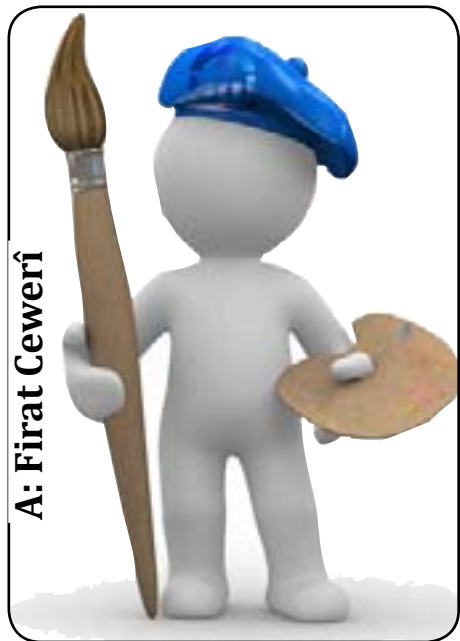
A: Firat Cewerî