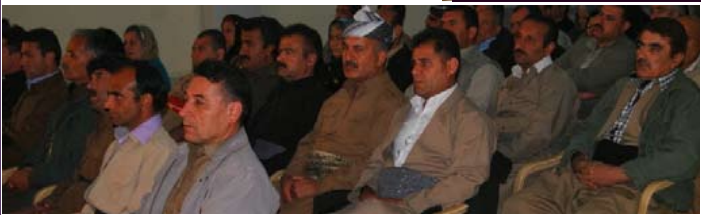
Doma R: 1